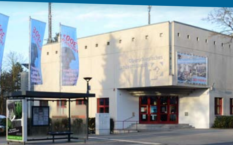
Straßenansicht des Landesmuseums

Ihre Antwort benötigen wir bis zum 4.3.2013.