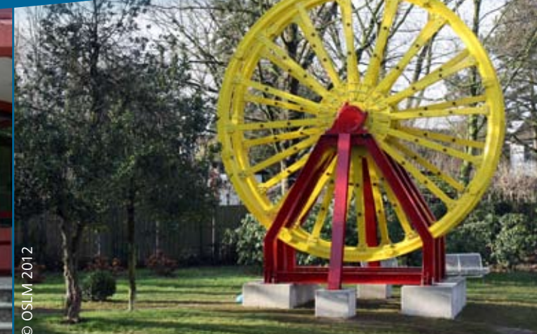
Alte Seilscheiben als neues Denkmal