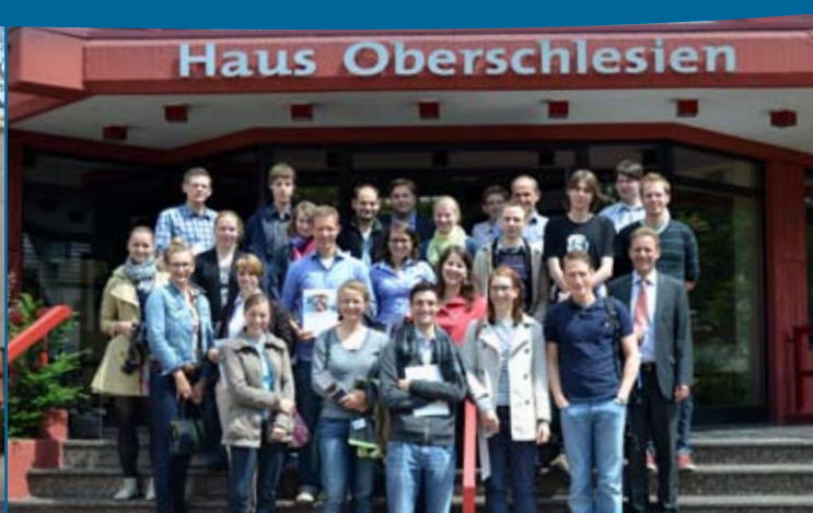
Gruppenbesuch im Haus Oberschlesien