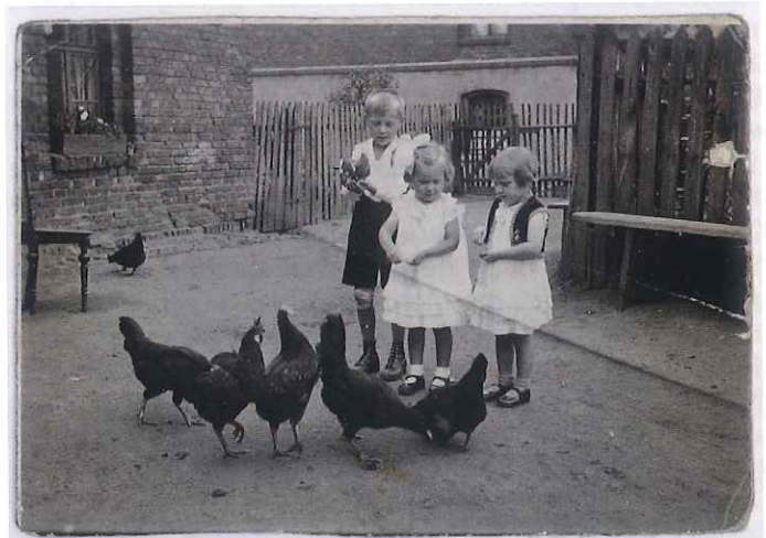
Kindheit in Beuthen/Oberschlesien

Preis: 9 Euro inkl. Eintritt, Führung, Materialien Anmeldung unter mitmachen@oslm.de oder 02102/9650