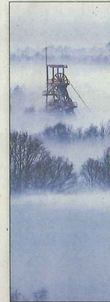
Das Steinkohlenbergwerk Ziemowitz.

In der Auseinandersetzung mit den fotografischen Arbeiten von „KARBON“ haben Schülerinnen und Schüler der Jahrgangsstufe 10 der Liebfrauenschule in Ratingen ihre Sichtweise des Umgangs mit Schöpfung, Natur und Umwelt künstlerisch verarbeitet. Im Kunst- und Religionsunterricht sind beeindruckende Kunstwerke entstanden. Die Gemälde, Fotografien, Zeichnungen und Plastiken werden gemeinsam mit den Fotoarbeiten von „KARBON“ ausgestellt. Die Arbeiten spiegeln die Sichtweisen der Schülerinnen und Schüler auf aktuelle Themen, die die Jugend besonders beschäftigen. Bestandteil des Projekts war auch das Kennenlernen der Ausstellungskonzeption und -planung. So haben die Schülerinnen und Schüler eigene